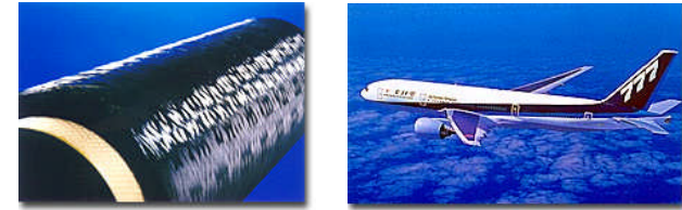
Karbonfasern und ihre Anwendung

Entwicklung innovativer Technologien ist unverzichtbar. Japan will den technologischen Durchbruch anführen.