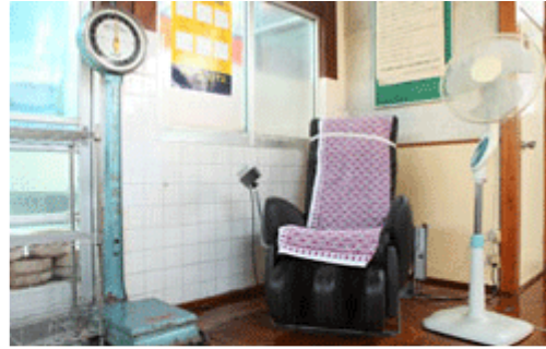
Links: Ein Stapel mit hölzernen Waschbottichen – ein üblicher Anblick in einem Sentō . Diese Bottiche werden jedes Jahr durch neue ersetzt. (Inari-yu, Tokyo)