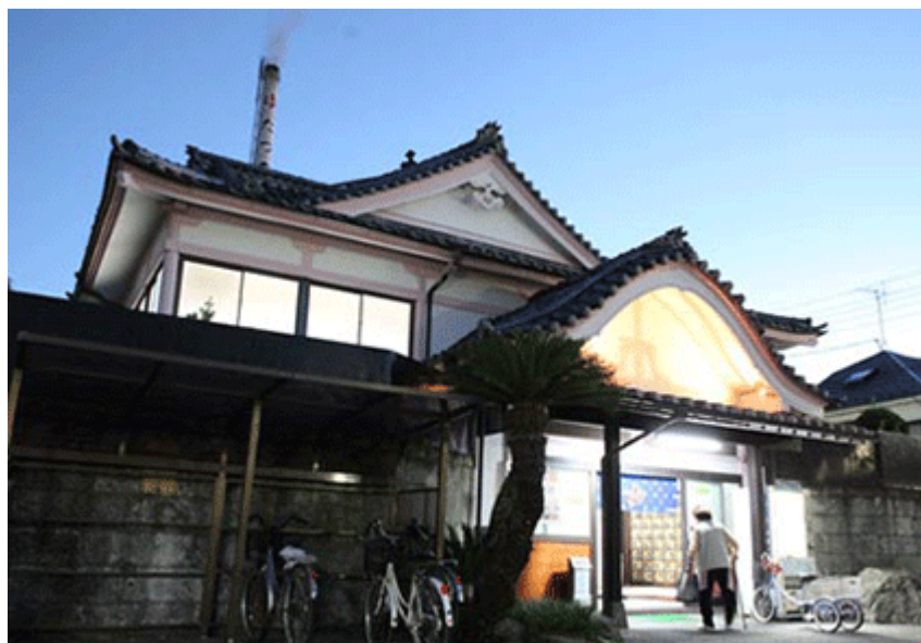
Wie die äußerst schöne Erscheinung belegt, orientierte man sich beim Bau mancher Badehäuser an der Architektur von Tempeln und Schreinen. (Tatsu-no-yu, Tokyo)

Jahren zahlreiche Badehäuser umgebaut und entsprechend modernisiert, jedoch findet man auch heute noch in Tokyo zahlreiche Sentō , die ihre elegante traditionelle Architektur bewahrt haben. Bei einem Besuch in einem dieser Häuser kann man sich leicht vorstellen, wie diese eleganten Sentō bereits seit vielen Jahren als eine äußerst beliebte Form der Geselligkeit für die Menschen in Japan fungieren.