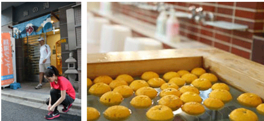
Links: Ein Sentō in der Nähe des Kaiserpalastes in Tokyo ist unter Läufern beliebt, die ihre Runden um den Palast drehen. (Ume-no-yu, Tokyo)

Es sieht so aus, als würden die Menschen in den japanischen Städten die traditionellen Badehäuser wieder neu für sich entdecken, die sowohl einen guten Ort für Entspannung als auch für die Pflege von Kontakten und den Austausch von Informationen darstellen.