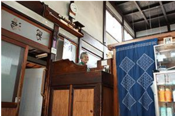
Der bandai genannte Schalter. Hier können Gäste nicht nur den Eintritt bezahlen, sondern auch Dinge wie Handtücher, Seife oder Shampoo kaufen. (Inari-yu, Tokyo)

Mit der hereinbrechenden Abenddämmerung nimmt auch die Zahl der Menschen deutlich zu, die unter einen Stoffvorhang oder noren hindurch schlüpfen, auf dem das Schriftzeichen für „heißes Wasser“ zu lesen ist, um so in ein Sentō zu gelangen. Nach Betreten des Badehauses ziehen die Gäste ihre Schuhe aus und gehen zu einer Art erhöhtem Schalter ( bandai ), wo die Aufsichtsperson des Badehauses sitzt. Heute haben viele Sentō ihre Inneneinrichtung neugestaltet, und man findet nun oft auch moderne Kassenschalter, aber viele Gäste haben eine ganz besondere Vorliebe für die traditionellen bandai . Die Eintrittspreise variieren je nach Region, jedoch liegen sie in der Regel zwischen 300 und 450 Yen für einen Erwachsenen.