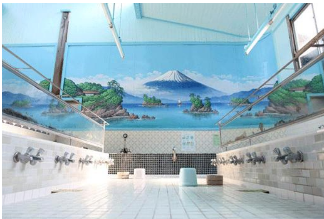
Ein riesiges Gemälde des Berges Fuji auf der Wand des Sentō Inari-yu in Tokyo. Dieses Badehaus ist auch als Drehort für einen Film bekannt, der auf der beliebten Manga-Serie Thermae Romae basiert. (Inari-yu, Tokyo)

In Japan findet man ein breites Spektrum an Einrichtungen für das Baden, das von gemütlichen heißen Quellbädern bis zu riesigen Anlagen in der Art eines Themenparks reicht. Ein wichtiger Bestandteil dieser Einrichtungen sind die Sentō , die öffentlichen Badehäuser, die mit ihren großen Badebecken das Bild des Badens in Japan prägen. Egal, ob in den schwül-heißen Sommermonaten oder während der kalten Wintertage - die Sentō mit ihren einzigartigen architektonischen Designs haben das öffentliche Baden zu einem festen Bestandteil der Alltagskultur der Menschen in Japan gemacht, die in dieser Form bereits seit Jahrhunderten besteht.